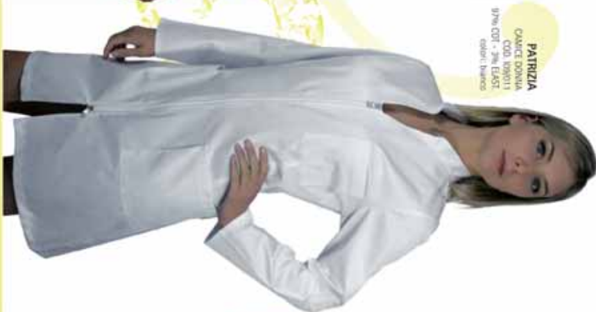
PATRIZIA QUARCE DONNA COD. 836011 97% COT - 3% ELAST colori: bianco