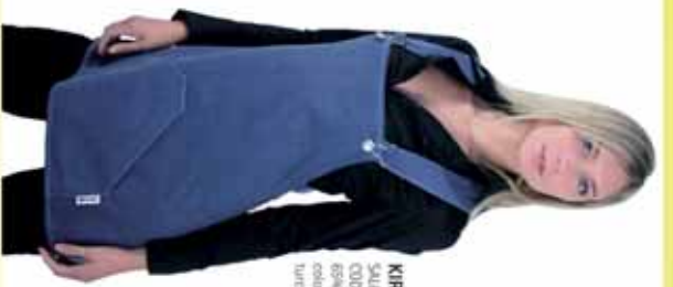
KIRA SALZETTE PONCHO COD. 802944 65%ACET 35% POLY INGLANTHERNE colori: leanu, renu, bianco, arancio, turcheo, fucola, itala, verde