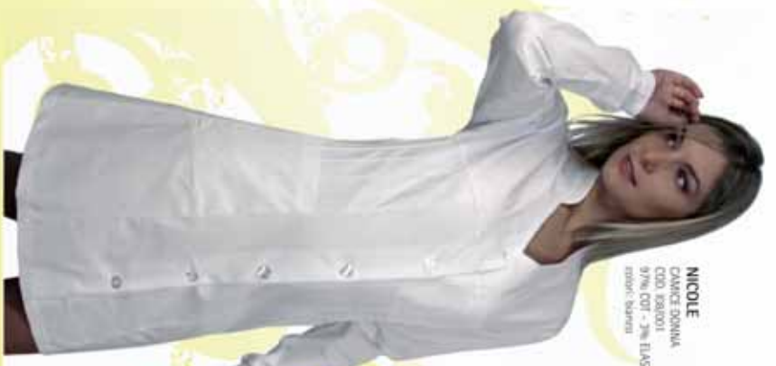
NICOLE QUARCE DONNA COD. 836001 97% COT - 3% ELAST colori: bianco